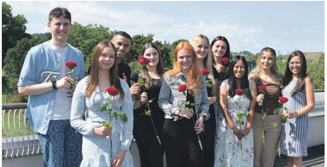
(von links nach rechts)